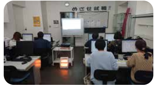
ゆとりのあるスペース。快適な環境で授業が受けられます。