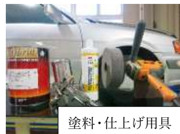
塗料・仕上げ用具