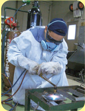
Soldagem e corte a gas