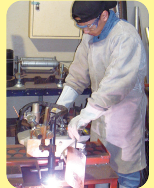
Corte a plasma