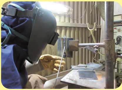
Soldagem eletrodo revestido