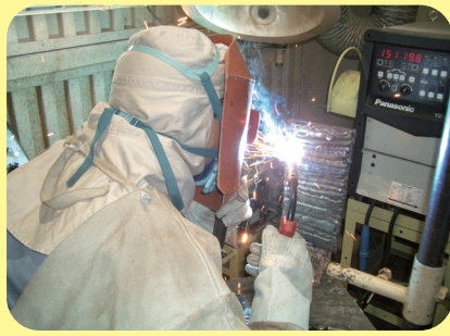
ようせつ CO 2 ・MAG溶接