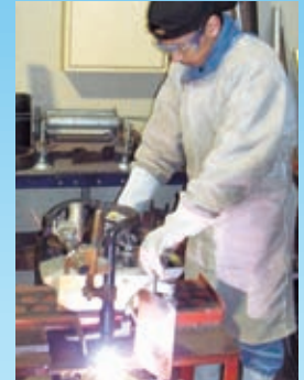
corte a plasma