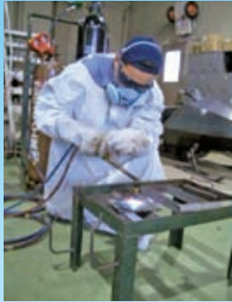
soldadura y corte a gas