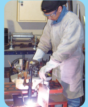
Corte a plasma