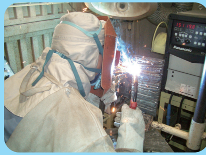
Soldadura CO 2 -MAG