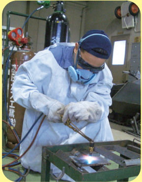
Soldadura y corte a gas